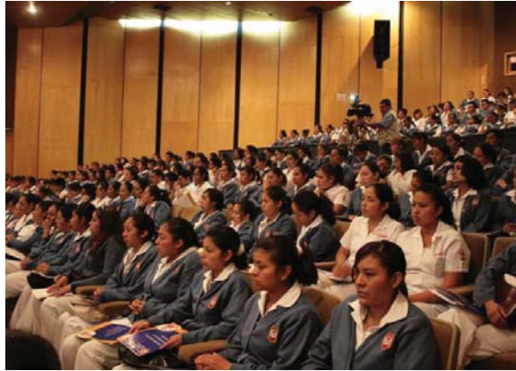
Estudiantes de la Licenciatura en Enfermería.