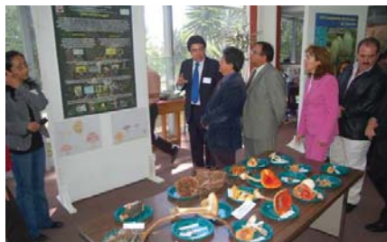
“XVI Exposición de Hongos de Tlaxcala”