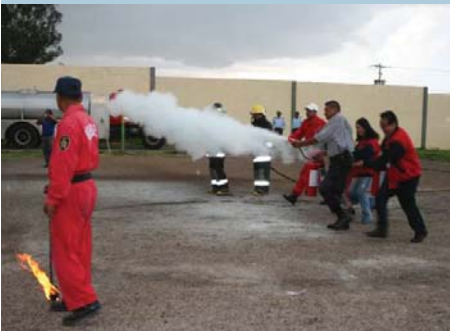
Actividades de las brigadas de protección civil.

Refirió que con la experiencia adquirida “estaremos atentos a evitar posibles desastres como el sucedido en la Facultad de Ciencias Básicas, Ingeniería y Tecnología (en la que debido al desbordamiento de un río, se registraron cuantiosas pérdidas en los laboratorios y en equipo de cómputo), en la que se están desarrollando innovaciones tecnológicas precisamente para evitar desastres y otorgar mejores condiciones de vida a la comunidad”.